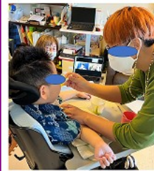
体調、生活のリズムに合った状況、時間帯で専門医の指導を受けることが可能になる

医ケア児は、皆さんのお近くにもきっとおられます。社会全体で支えて共に進んでいけるように皆様のご理解ご協力をお願いします。