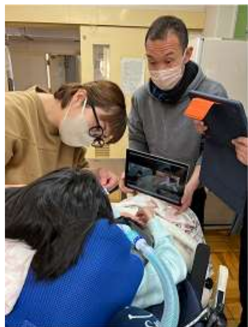
特別支援学校で、保護者と教員、歯科医、専門医がオンライン活用で指導しているところ

児童はご自宅にいて来院は極めて困難ですので訪問することが殆どですが、実際の生活の場で「命を支える医療」の傍で生活に寄り添う、子どもと保護者に寄り添うことを大切にしています。実際には口腔ケア、摂食指導(安全に食事を食べる、飲み込むための指導)、歯石の除去や生え替わりの乳歯の抜歯等々を行っていますが、健全なお子さんと同じように健診や、フッ素等の予防処置を受けることは保護者の大きな喜びです。永久歯への生え替わりはお子さんの成長をはっきり感じられるイベントであり、そこを上手く支援することが保護者への支援にもつながります。